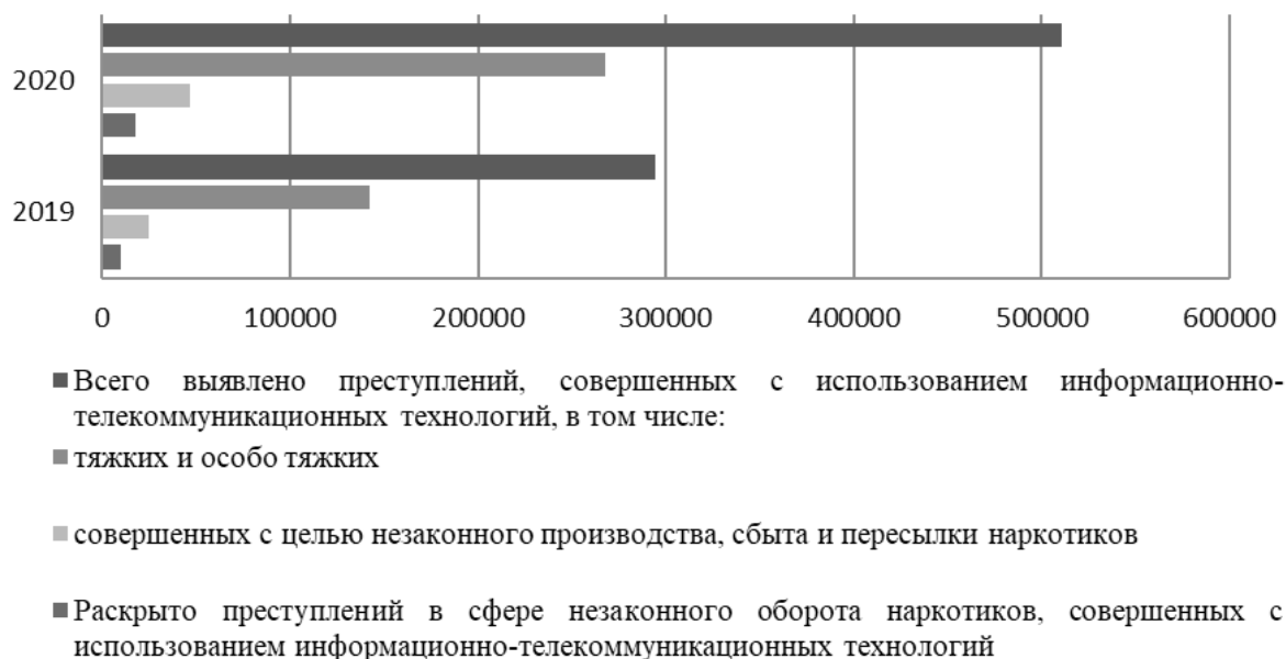
Рис. 3. Количество преступлений, совершенных в 2019-2020 годах с использованием информационно-телекоммуникационных технологий

Указанную позицию подтверждают данные о состоянии преступности в Российской Федерации в 2020 году, опираясь на которые можно сделать вывод о том, что произошел резкий рост (+73,4 %) количества преступлений, совершенных посредством информационно-телекоммуникационных технологий, при этом каждое одиннадцатое преступление (9,2 %) совершается с целью незаконного производства, сбыта или пересылки наркотиков*** (см. рис. 3).